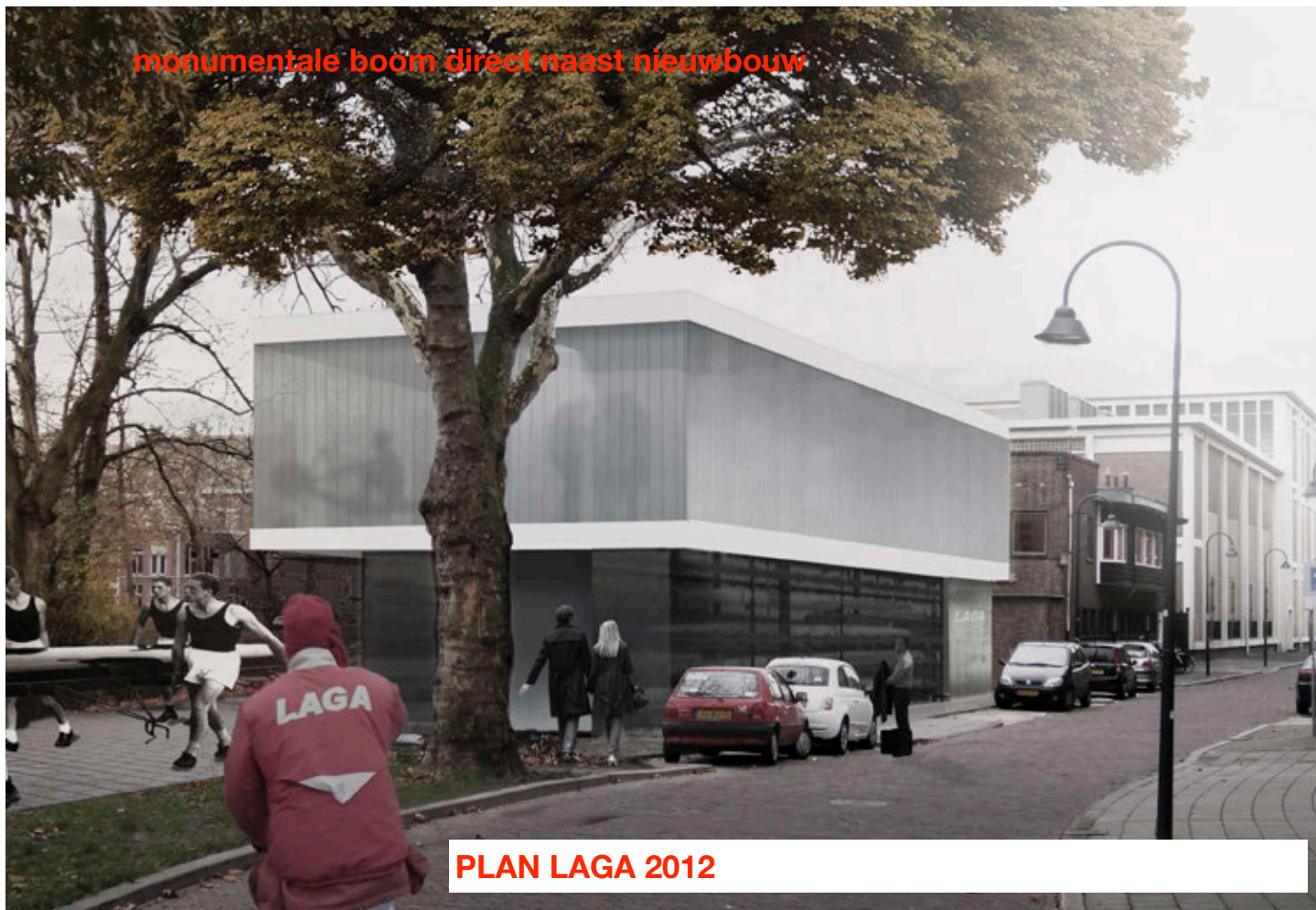
PLAN LAGA 2012