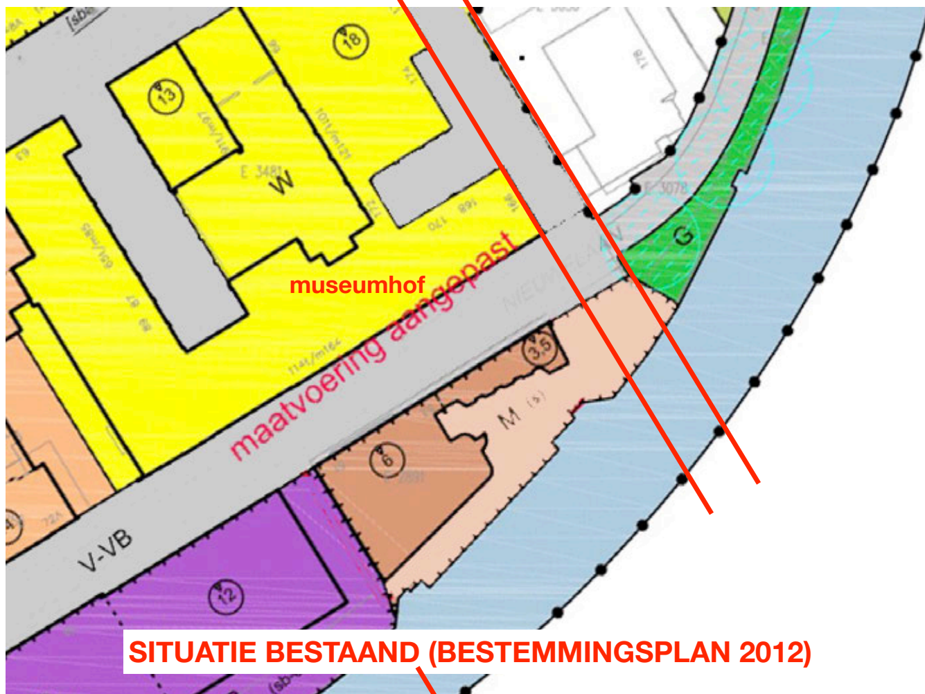
SITUATIE BESTAAND (BESTEMMINGSPPLAN 2012)