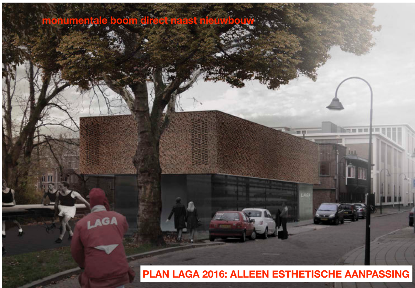
PLAN LAGA 2016: ALLEEN ESTHETISCHE AANPASSING